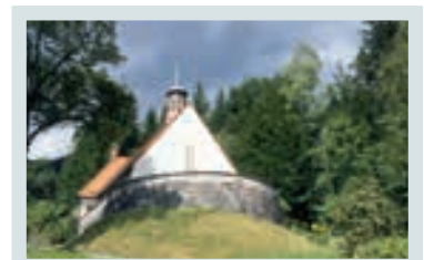
Evangelisches Waldkirchlein, St. Aegydt