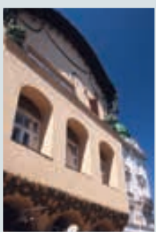
Olbrich-Haus, St. Pölten